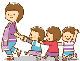
利用者負担額（1号：教育）