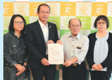
18日 腎友会要望対応