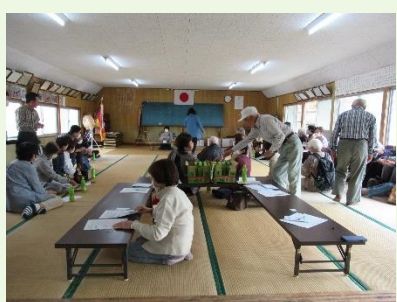
盛り上がりを見せた大抽選会