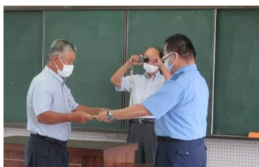
警察署長から表彰を受けました

この賞は、さつま地区、鹿児島県での表彰を受けた方ではないと受賞できません。長年にわたって安全運転に努められた結果だと思えます。今後も模範となる運転で、不幸な交通事故が起きないようにご指導いただきたいと思います。(館長)