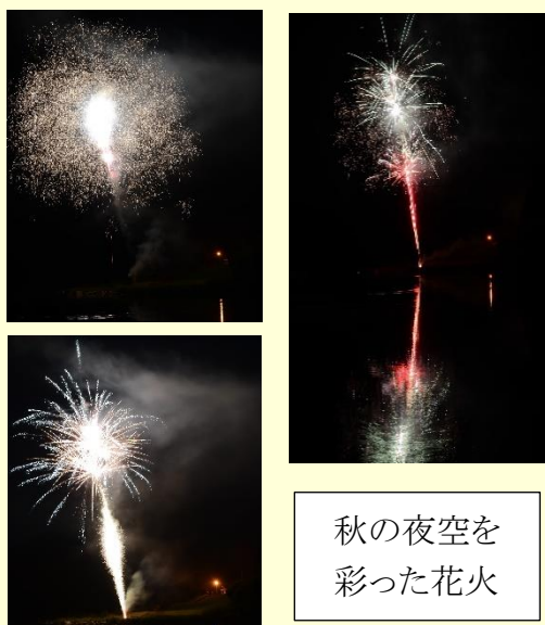
秋の夜空を 彩った花火