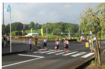
声掛けも忘れません