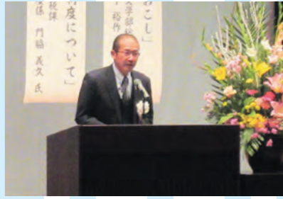
11日 町農林業振興大会