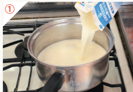
① 鍋に牛乳を入れて90℃くらいになるまで温めます。

カッテージチーズは、牛乳から脂肪分を除いた脱脂乳を原料にしたチーズです。脱脂乳は牛乳に比べ、低カロリーで牛乳と同じ量のタンパク質やカルシウムをとることができます。ハウレン草などマグネシウムを含む食品と一緒にとると、カルシウムの吸収率がさらにアップします。④でこした液体はホエイと言い、タンパク質やミネラルなどが豊富です。捨てずに米と一緒に炊いたり、炒め物に混ぜたりして活用しましょう。