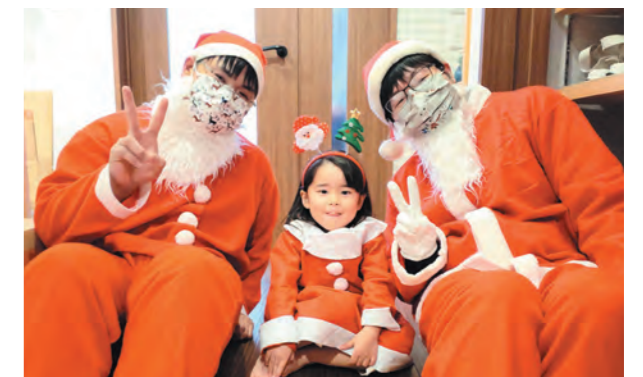
サンタの衣装とカチューシャをかきわいくお出迎え

12月24日、サンタクロースが町内17軒の家を訪問し、46人の子どもたちにクリスマスプレゼントを届けました。今回サンタとして家を回ったのは町青年団員14人。突然の登場に子どもたちは大喜びで「どこから来たの?」「トナカイさんも一緒?」と興味津々に質問していました。プレゼントを受け取った後は、手紙を渡したり、一緒に記念撮影をしたりしてサンタとの交流を楽しみました。