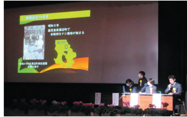
薩摩中央高校によるナシのジョイント栽培の事例発表