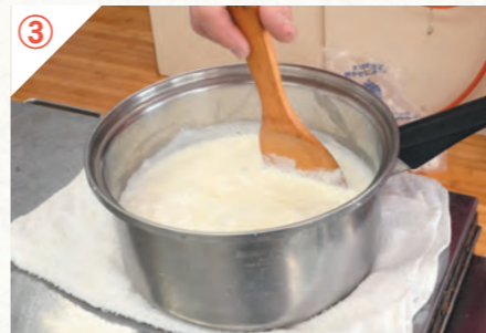
③ 火から外して2分ほど休め、木べらでゆっくり混ぜます。