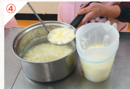
④ 40℃くらいまで冷ましてネットで水気を切ると、カッテージチーズができます。