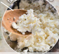
カッテージチーズ