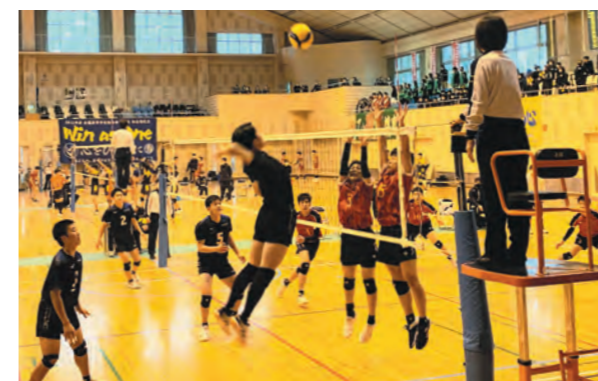
好プレーの応酬で会場を沸かせました