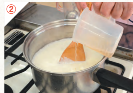
② 弱火にして米酢を回し入れます。