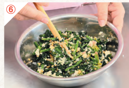
⑥ ハウレン草と④のカッテージチーズ、刻んだクルミ、めんつゆを和えて完成。