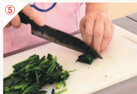
⑤ ハウレン草をゆでて一口大に切ります。