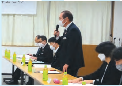
20日 郡歯科医師会との意見交換会