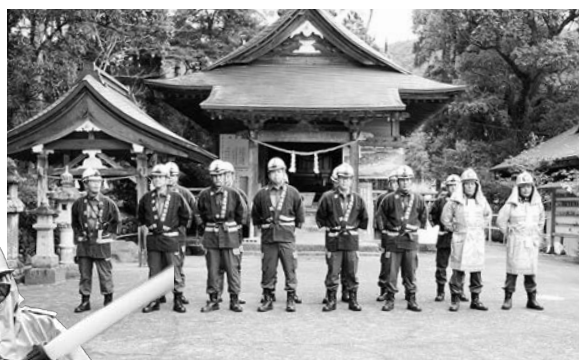
紫尾神社にて消火訓練を実施

紫尾には県外からも観光に訪れる温泉や神社があります。人命だけでなく、そのような愛する地域の財産を守ることは私達の使命であり、誇れることでもあります。