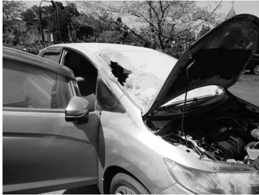
ダッシュボードに置いた充電器から出火し、フロントガラスが割れた様子

近くにいた男性2名が消火器で消火したため、最小限の被害で済みました。太陽光により充電を行うものですが、過度な高温下であれば出火することもありますので、高温となる場所での使用は控え、日頃からバッテリーの状態をチェックしておきましょう。