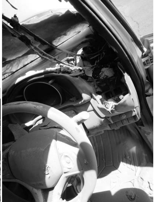
運転席付近焼損の様子