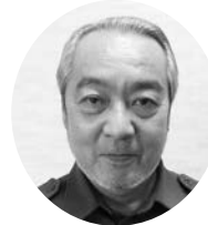
東部方面隊長 日高 浩一