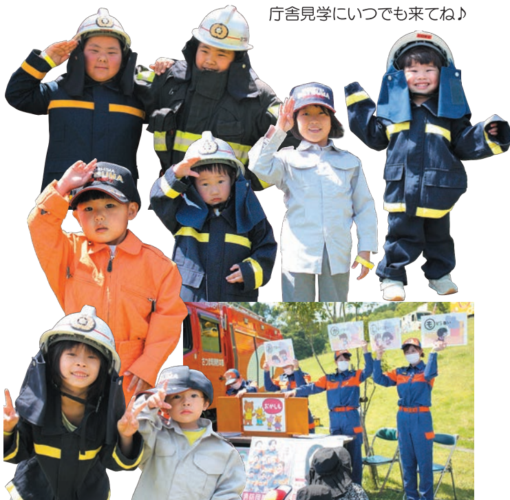
消防団女性部による紙芝居は大盛況!