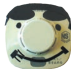
住警器どん (煙感知器)