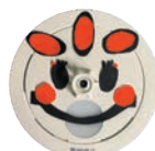
新キャラクター 住警器ねっ子 (熱感知器)