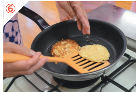
焼き目が付いたら裏返す。両面に焼き目が付いたら完成。