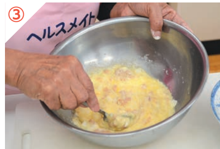
ボウルに①、②、Aを入れてよく混ぜる。