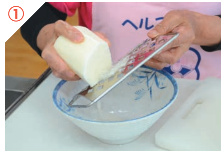
長いもをすりおろす。

長いもは、他のイモ類と比べてカロリーが低く、ビタミンや食物繊維が豊富です。ツナと組み合わせることで、栄養バランスが良くなります。筋肉量の維持・増加につながるため、介護食にもおすすめです。