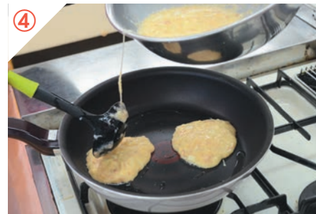
フライパンに油を引き、③を入れて弱火～中火にかける。