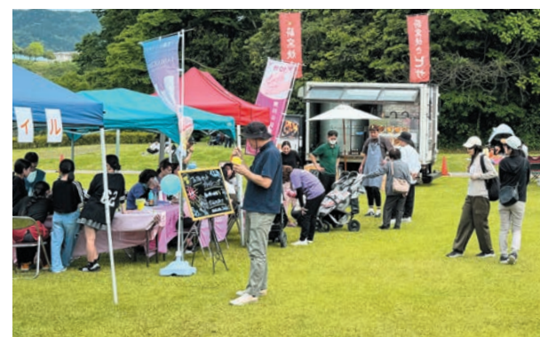
好天に恵まれ多くの来場者でにぎわいました