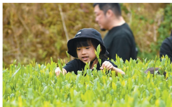
教わった摘み方で早速お茶摘み！

5月5日、「さつま町旬を味わう遠足」が行われ、24人が参加しました。町内の旬な食べ物や体験を楽しんでもらおうと薩摩のさつまブランド推進協議会が企画。同ブランド認証事業者の柳田製茶による新茶摘み体験や、山崎農場による畑耕し体験が行われたほか、同農場の米で作ったおにぎりとさつま食品のみそを使った茶節が振る舞われ、参加者はさつま町の初夏を満喫しました。