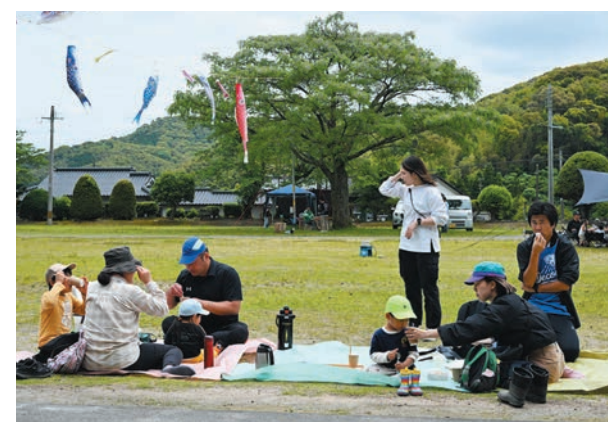
外でシートを広げておにぎりや茶節を味わいました