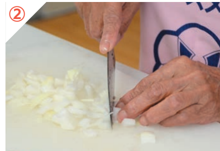
タマネギを粗みじん切りにする。