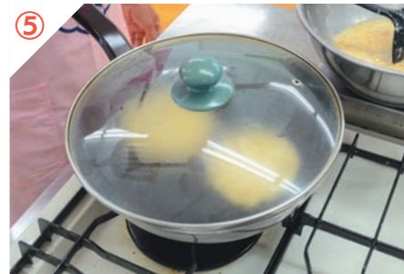
ふたをして蒸し焼きにする。