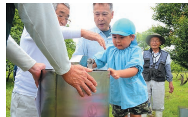
遠心分離器を使って上手に搾れました

4月30日、佐志地区で蜂蜜搾り体験が行われ、佐志保育園の園児18人が参加しました。蜂蜜ができるまでの過程を知ってもらおうと、県養蜂協会と川薩養蜂組合さつま支部が企画。去年11月に園児がレンゲソウの種をまいた田んぼで、蜂蜜を採取しました。園児は、巣箱に入った蜂の群れを観察した後、遠心分離器を使って蜂蜜を搾り、最後は搾りたての蜂蜜をうれしそうに持ち帰りました。