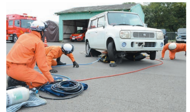
消防本部で整備したマット型エアージャッキ