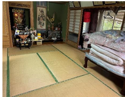
8 帖 ①