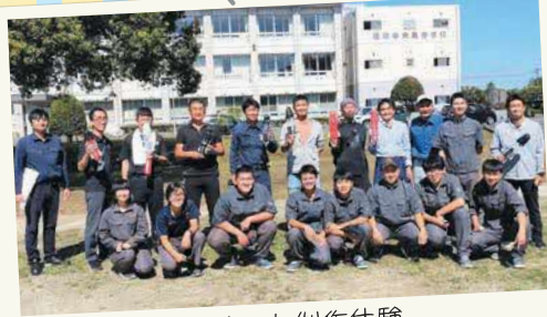
水口ケット制作体験

第3回目から地元の高校生 薩摩中央高校の皆さんが まちゼミに参加！ 人気講座となっています。 地元の高校生による講座 是非ご参加ください★