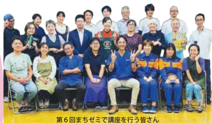
第6回まちゼミで講座を行う皆さん

「お店に入ったらか買わないといけない!」といったプレッシャーを感じずにお店に入れることだと思います。私がこれまで行った講座の受講者も、9割近くは初めて来店された方で、「ウチ薬局の前を通るたびに気になってはいたけど、敷居が高いかなー」と思ってお店に入れなかったんですよ。でも、思い切ったまちゼミに参加してみました」と話された方もいました。また、複数人で受けら