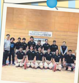
ウェイトリフティング部