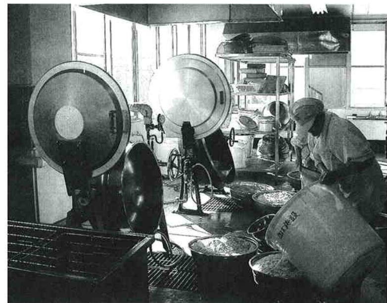
利用者が伸びている農産物処理加工施設

A 機材等も16年目を迎えて老朽化しているため、あらかじめ当初予算で多く予算を確保していたため残った。基本的に、耐用年数が過ぎても取り換えるのではなく、故障の際にすばやく対応するようにしている。14年度に対しての利用の伸びは、件数で110%