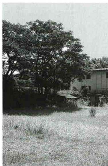
分譲宅地化の予定がある旧役場跡地（鶴田麓地区）

町長 これまでの総合振興計画の進捗は、厳しい財政環境の中で概ね順次総合振興計画が策定され、今年度で4年目を迎えました。そして合併予定日まで、あと約9月の段階にきていますが、そうしたなかで、今後振興計画の展開をどのように考えているか、また現在の進捗を含めての考えを伺いたい。