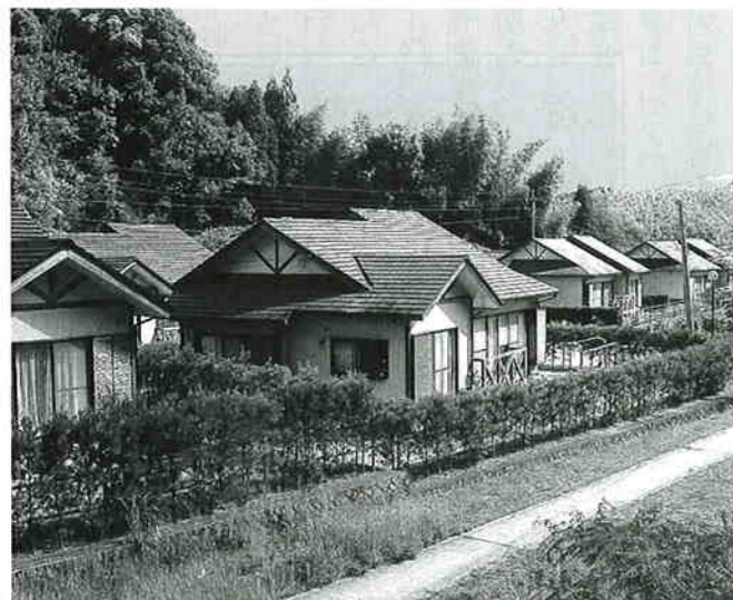
町営住宅へ入居の際には、集落へ加入するよう指導している