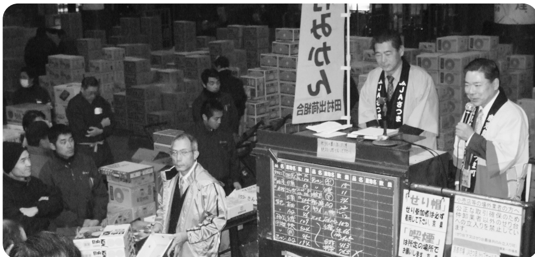
大阪中央青果株式会社果実売場のせり台でPRを行う町長

町長 特産品づくりを農工商等連携を進め、新商品の開発に努力しながら消費者が求める安全・安心な農作物をはじめ、積極的にPRを行い、地域活性化と所得向上に努力してまいりたいと考えております。