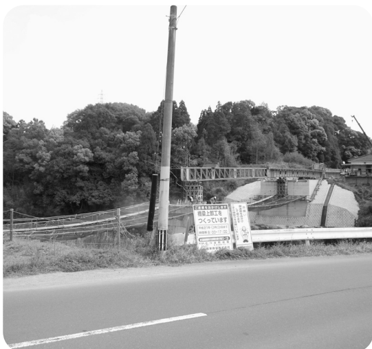
工事中の町道佐志駅穴川線（橋梁上部工）

町長 総合振興計画や合併協議での申し合わせ事項に基づいて、緊急度、重要度、優先度を考慮しながら進めたい。21年度までに主要町道1級・2級町道の28路線を計画的に進めています。21年度13路線が整備済みとなります。