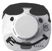
住警器どん (住警器啓発キャラクター)

おいどんが、住宅用火災警報器の点検方法について、くわしゅ、ゆっかすっで、こんQRコードを読みとって、みてくいんやん!