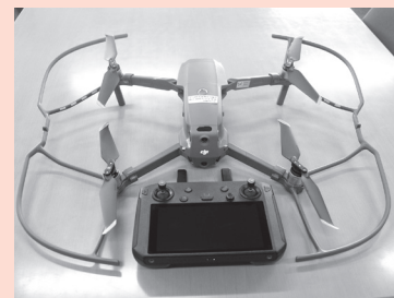
今回導入した 最新型ドローン