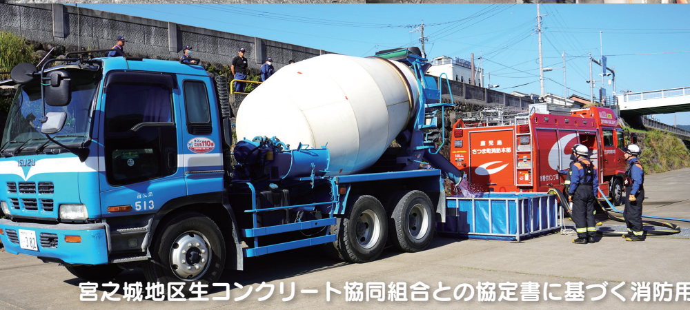
宮之城地区生コンクリート協同組合との協定書に基づく消防用水確保訓練 (虎居川内川河川敷)