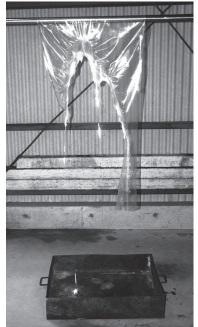
飛沫感染防止用シートが燃えている実験時の様子

事例 ② レジカウンターに天井吊り下げ式の飛沫防止用シートを取り付けたところ、近くにあったダウンライト照明の熱でシートが溶けてしまった。