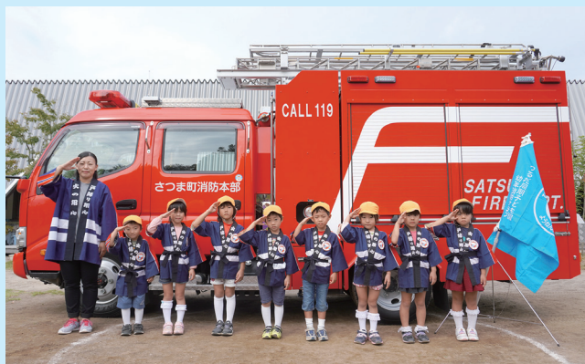
つるだ同朋子ども園