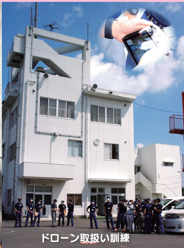
ドローン取扱い訓練