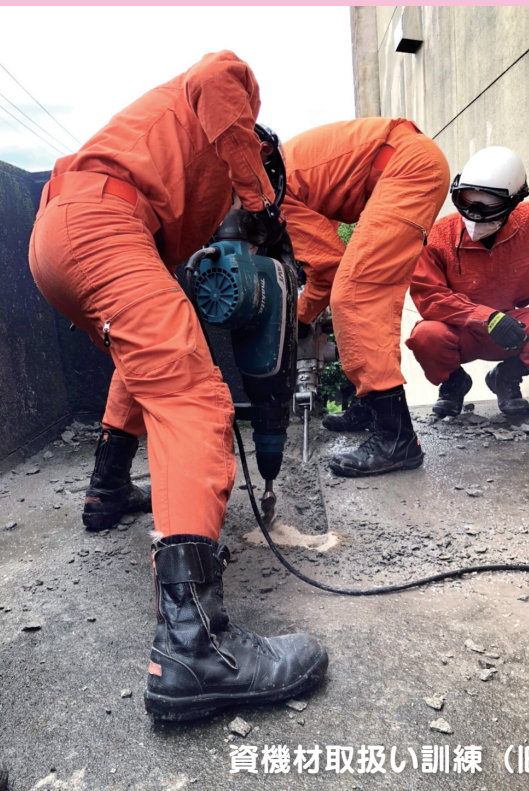
資機材取扱い訓練 (旧鶴田中学校)