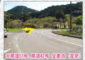
※県道51号、県道42号 交差点（左折）