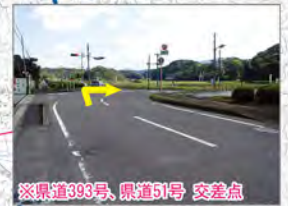
※県道393号、県道51号 交差点 （宮之城総合グラウンド、山崎地区公民館、久富木地区公民館からは右折）