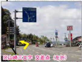
※山崎三文字 交差点（左折）

また、災害発生時には、モニタリングポストの監視に加え、可搬型モニタリングポストの追加配備やモニタリングカーによる移動測定などの「緊急時モニタリング」が行われます。