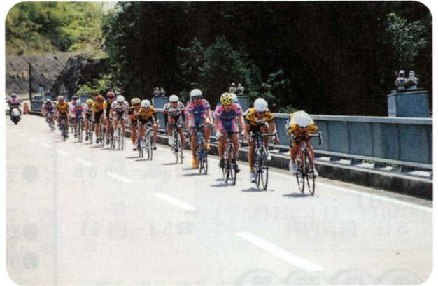
時速80kmを超える戦い（チャンピオンクラス）