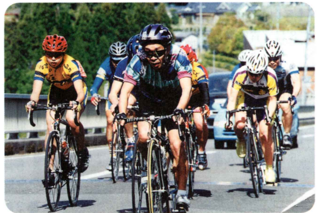
日頃鍛えた健脚を競う参加者