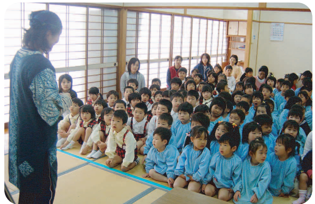
夢中で見入る子どもたち