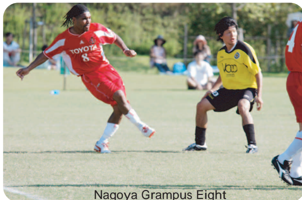
Nagoya Grampus Eight 観客を魅了した一流のプレー