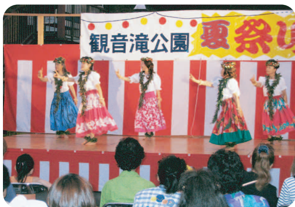
フラダンスの披露