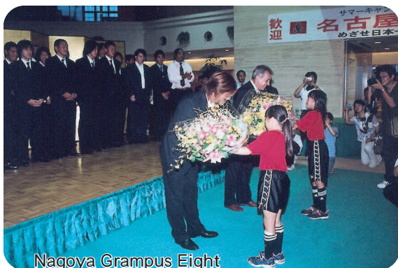
Nagoya Grampus Eight