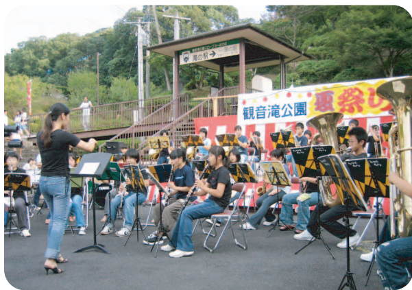
盛り上がったコンサート

祭りの最後には、約80発の打ち上げ花火と仕掛花火が夏の夜空にあがり、たくさんの人たちの目を楽しませました。