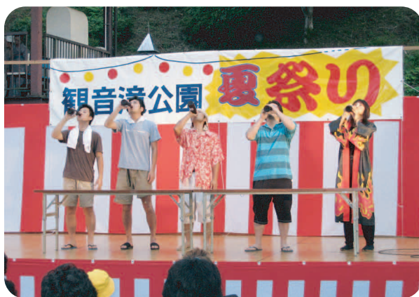
ビールの早飲み挑戦