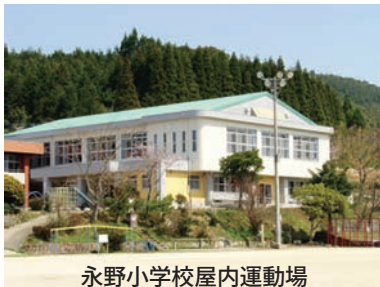
永野小学校屋内運動場

平成17年度はさつま町建設計画に基づき、住民生活に密着した町道の整備や農道、林道をはじめとする農村環境及び各種農林業生産基盤整備事業のほか、住宅団地建替事業、小学校屋内運動場の整備など多くの事業に取り組みました。