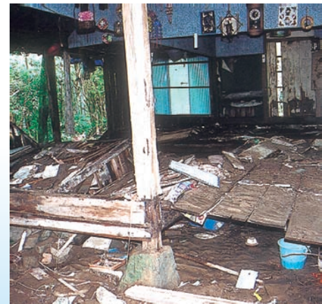
濁流にのまれた家屋内（小路下手）