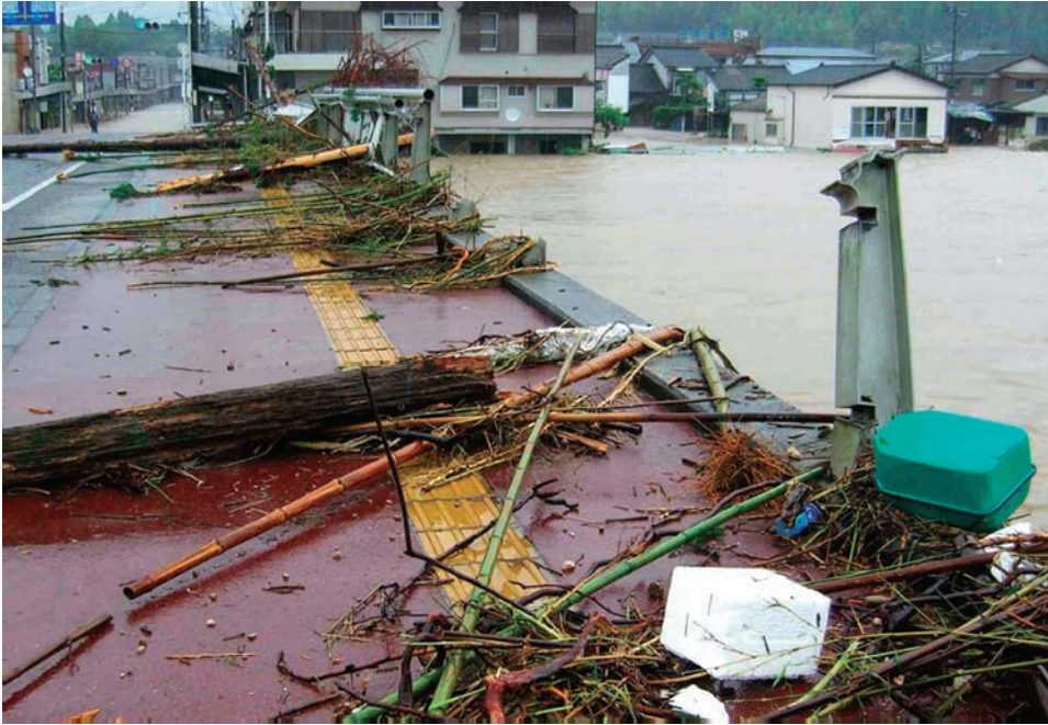
流木などが流れ込み、破損した宮之城橋欄干