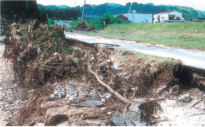
壊滅状態の二渡ホテル道（川内川沿い道路）