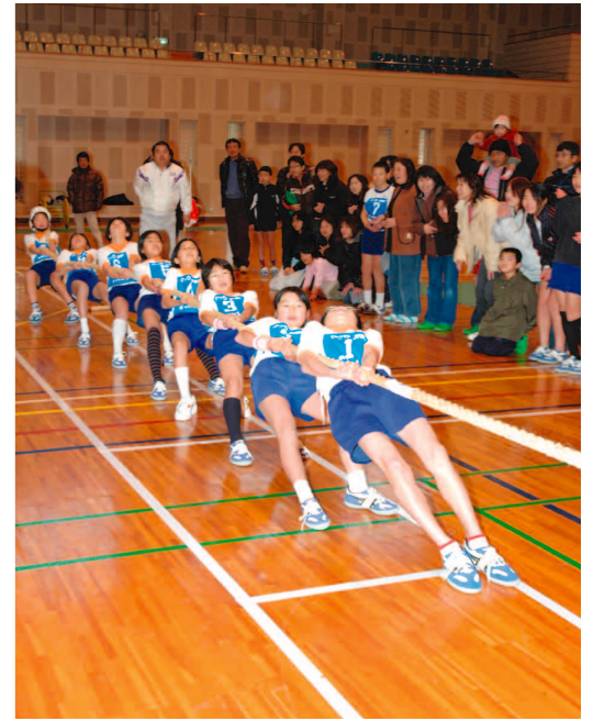
力を合わせて綱を引く佐志小ガラッパーズ

1月27日、宮之城総合体育館で第3回さつま綱引選手権大会が開催されました。一般男子の部5チーム、一般男女混成の部5チーム、小学生フリーの部3チーム、小学生280kg以下の部4チームの計17チームが参加し、日頃鍛えた力とチームワークで熱戦を繰り広げました。結果は次のとおりです。