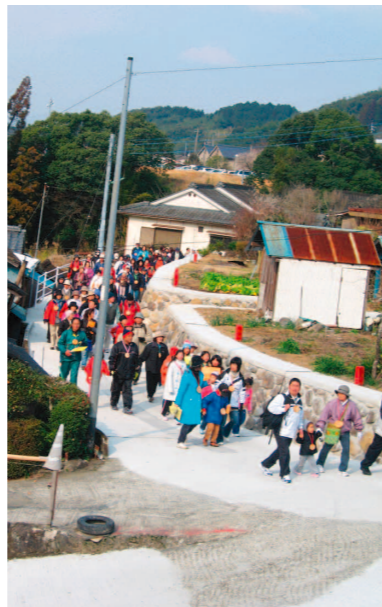
ウォーキングを楽しむ参加者

2月17日、永野地区で第3回永野ウォーキング大会が開催されました。当日は町内外から約570人の参加があり、300年ほどの歴史を持つ永野金山跡地を訪ねる「黄金ロード」を楽しみました。コース内には5箇所クイ