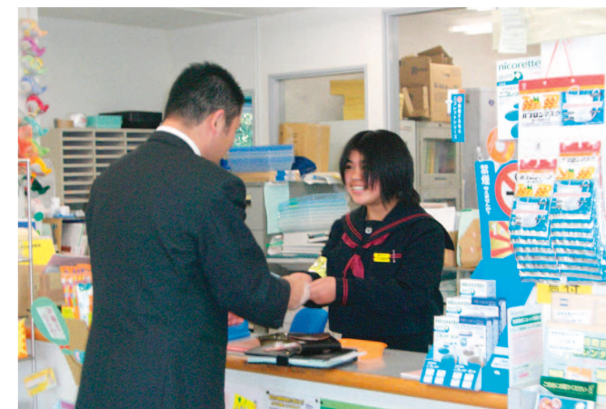
薬局で職場体験をする様子

1月21日から25日にかけて、鶴田中学校2年生の生徒が連続5日間の職場体験学習に取り組みました。昨年度は文部科学省の指定を受けて実施されましたが、今年度は学校独自の活動として実施されました。業種は、理容・美容、医院、幼稚園、保育園、書店、製造業、商店など多種多様です。町内の事業主の皆様のご理解とご協力のおかげで、一層充実してきました。生徒たちは、あいさつや接客マナー、仕事のノウハウに戸惑いながらも次第に職場に慣れ、普段の学校生活では体験できない多くのことを学びました。