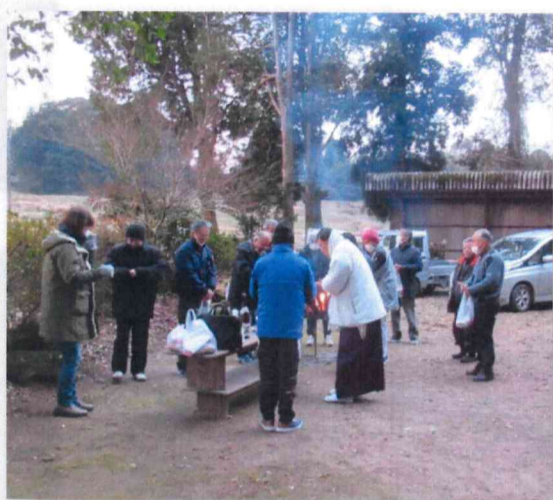
お神酒で家内安全を祈願