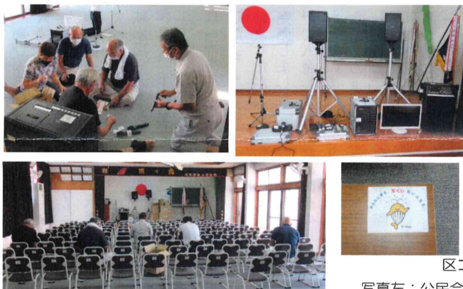
写真左：公民会長さんの協力による組立とシール貼り