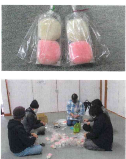
民生委員さんによる袋詰め