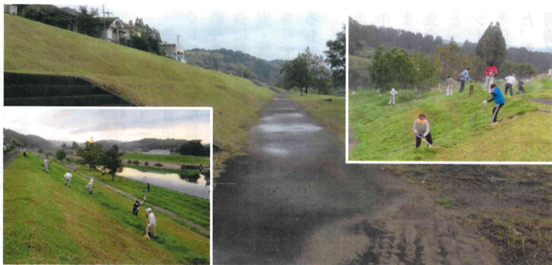
写真右上：草刈作業