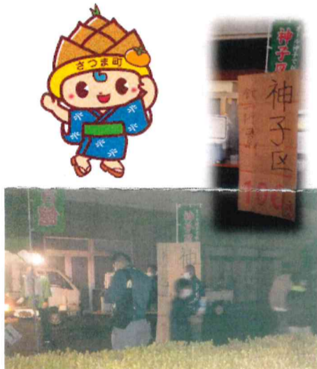
写真左：販売コーナー