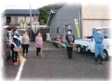
ご協力いただいた方を紹介する高下館長(写真右)

第一生命さんは、さつま町と「地域社会の発展」と「町民サービスの更なる向上」を推進するために「包括連携協定」を締結しています。今回はその一環としてお手伝いいただきました。なお、刈り取った草の持ち出しは業者さんにやってもらいました。出動された皆様ありがとうございました。