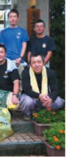
ゴミ拾いを行った商工会青年部員

6月18日、「商工会青年部全国統一事業『絆』感謝運動」が開催され、町商工会青年部員11人が、宮之城屋敷・虎居商店街を中心に「ゴミ拾い」を行いました。