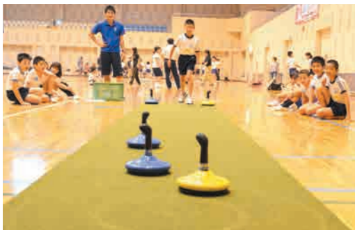
ユニカール（屋内カーリング）を楽しむ児童

6月13日、町総合体育館で6校親善スポーツ大会が開催されました。 これは、宮之城中学校に進学する小規模6小学校（泊野・柘野・流水・平川・白男・佐志）の5・6年生が、スポーツを通して交流を深めることを目的に開催されています。 当日は、68人の児童が各校混合チームで6種目のユニカールに挑戦しました。参加した児童は、「はじめは不安もあったけど、すごく楽しかった」と感想を述べました。