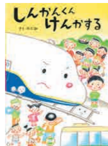
しんかんくん けんかする (あかね書房)