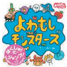
よわむしモンスターズ (講談社)

「ママがおぼけになっちゃった!」は、僕の最高傑作だから良かったら読んでください(*_*)