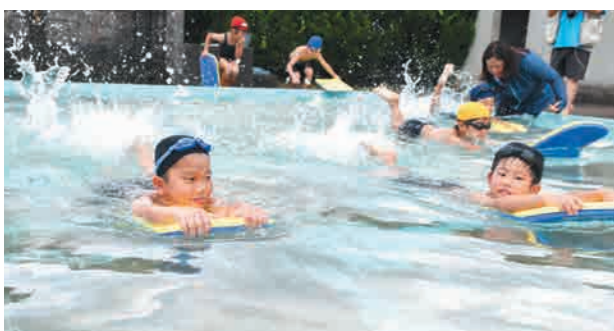
ビート板を使ってバタ足で泳ぐ児童

種目の最後には、同校卒業生を含む父母9人が100mリレーに参加し児童と競争しました。接戦の結果、母親チ