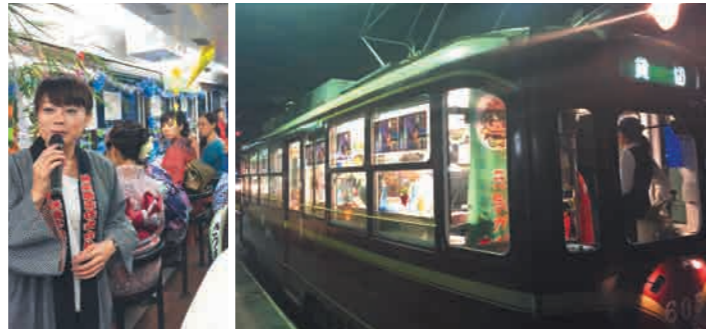
焼酎電車が市内をゆっくりと駆け抜けました 車内の様子