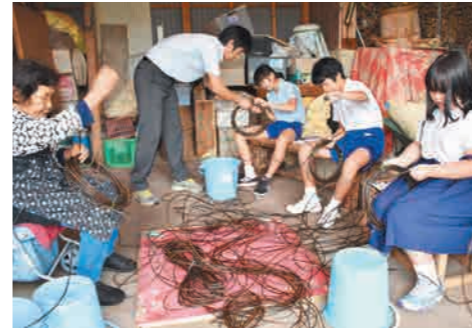
つづらを束ねて輪っかを作る様子

完成したリースに松ぼっくりや果物ネットで作ったリンゴなどを飾り付け、可愛らしいリースが出来ました。