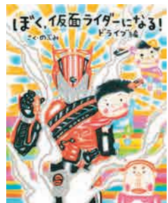
ぼく、仮面ライダーになる! ドライブ編 (講談社)