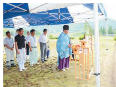
豊作祈願の神事の様子（山崎）