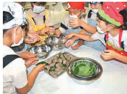
団子を葉っぱにのせる児童

途中、丸めるときに団子の手にくっつくこともありましたが、丸めた団子を約20分間蒸して、大小様々なけしん団子が完成しました。甘くておいしい団子を食べ、児童の表情は笑顔になっていました。