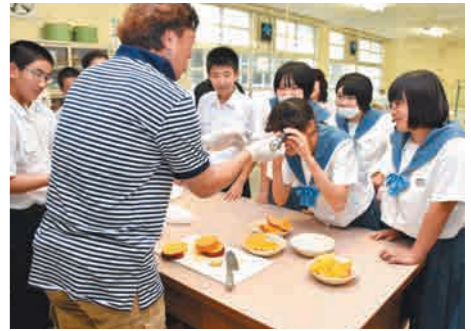
糖度を確認する生徒