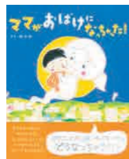
ママがおぼけになっちゃった! (講談社)