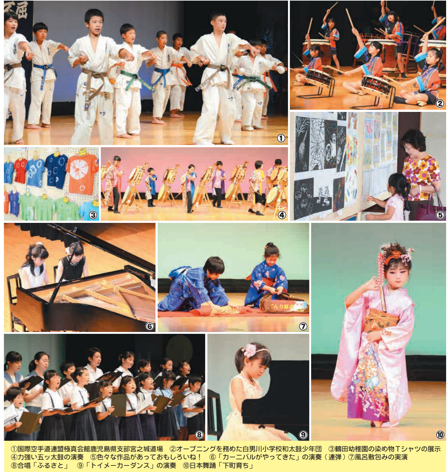
①国際空手道連盟極真会館鹿児島県支部宮之城道場 ②オープニングを務めた白男川小学校和太鼓少年団 ③鶴田幼稚園の染め物Tシャツの展示 ④力強い五ツ太鼓の演奏 ⑤色々な作品があっておもしろいね！ ⑥「カーニバルがやってきた」の演奏（連弾）⑦風呂敷包みの実演 ⑧合唱「ふるさと」 ⑨「トイメーカーダンス」の演奏 ⑩日本舞踊「下町育ち」

舞台発表は、白男川小学校和太鼓少年団の演奏で始まり、ダンスや五ツ太鼓、ピアノ演奏、舞踊、空手、礼法、合唱など15団体、146人の子どもたちによる発表が行われました。大人顔負けの演技を披露する子もいれば、初めての舞台に緊張する子もいましたが、元氣いっぱい、一生懸命に演じる姿に会場からは盛大な拍手が送られました。