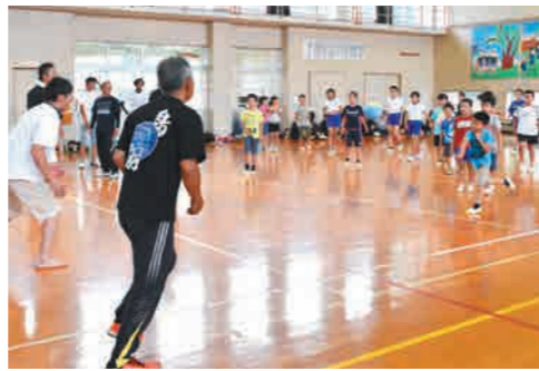
子ども対大人のドッジボール、どちらも真剣！