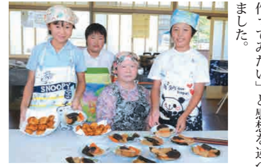
みんなできれいに盛り付けました

援をしたいと、お預かりした義援金は木尾校長宛てに直接送金されました。 また、6月30日、薩摩中学校の生徒会役員が薩摩教育係を訪れ、同校で集まった義援金を贈呈しました。