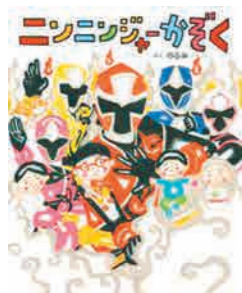
ニンニンジャーかぞく (講談社)