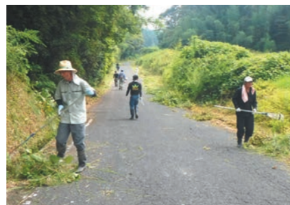
生活に欠かせない道路の安全を確保します

8月10日の「道の日」にあわせ、町内各所の町道などで清掃作業を実施しました。道の日とは、道路の重要性や正しい利用などについて、関心と理解を深めることを目的としています。当日は、町建友会会員や町議会議員、町職員など約200人が参加。道路沿いの除草・伐採などを行い、通勤や通学などで利用される町道の見通しが良くなり、安全できれいな道路になりました。