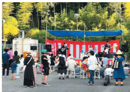
観音滝に響き渡る歌声に聴き入る来場者

8月13日、観音滝公園滝の宿で観音滝夏祭りが開催されました。祭りを盛り上げるイベントとして、カラオケ大会や地元バンド「姫と家来。」や「The honest」のライブ演奏などがあり、来場者も歌声に聴き入っていました。久しぶりに帰省していた親子連れからは「観音滝公園で河川プールだけではなく、夏祭りも楽しめてうれしかった」といった声も聞かれました。