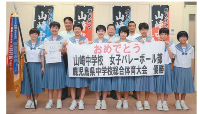
部員一丸となって目標に向かい、輝かしい結果として実を結びました

7月24日から26日、鹿児島県中学校総合体育大会バレーボール競技大会が霧島市で開催され、山崎中学校女子バレーボール部が初優勝に輝きました。同校として参加する最後の大会で、優勝旗に校名を残そうと部員8人が一丸となってつかみ取った栄冠でした。県代表で出場した九州総体でも勝ち進み、全国大会まであと1勝と迫りましたが、準々決勝と第5代表決定戦で惜しくも敗れ出場はなりませんでした。それでもベスト8という素晴らしい成績は、今年度で閉校となる同校の歴史に輝かしい1ページを刻みました。