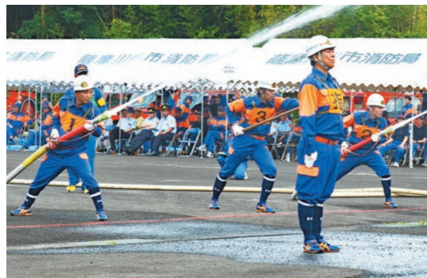
真剣な眼差しで放水する二渡分団