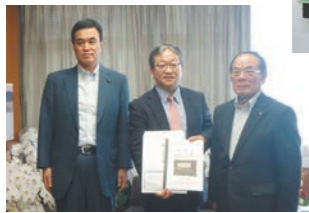
◀森国土交通事務次官（中央） に北薩横断道路の整備促進 を要望