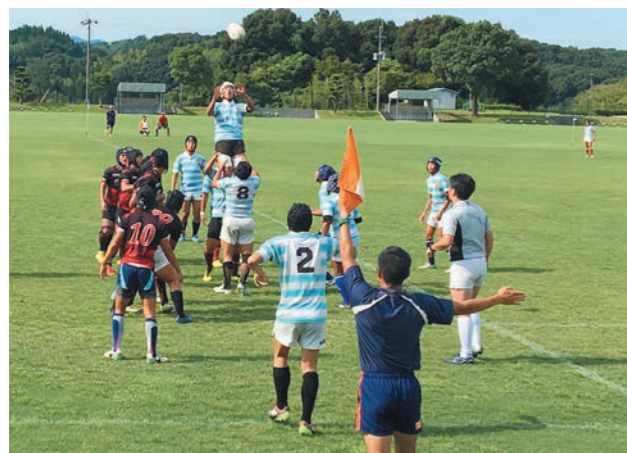
広いグラウンドでのびのびとプレーする選手たち

バレーボールでは、高校男子の合宿が8月9日から12日まで、中学女子の合宿が8月22日から24日まで宮之城総合体育館などで行われました。今回で30回という節目を迎えた中学女子バレーの合宿では、町内外から29校が参加し、互いに切磋琢磨しながら練習に取り組んでいました。