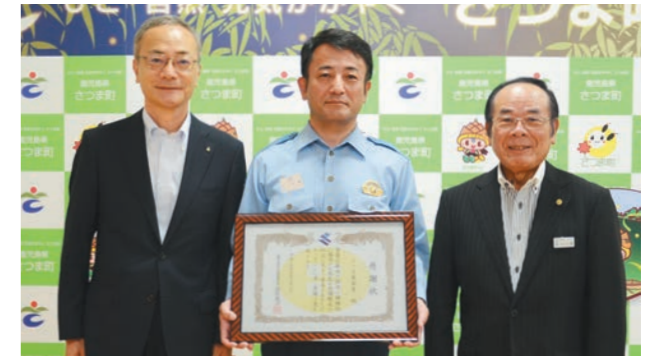
左から揚松所長、感謝状を手にする中島署長、日高町長