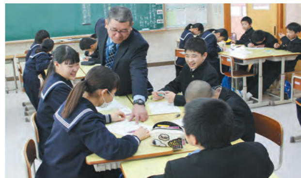
宮之城中は人権問題にグループワークで取り組みました

研究公開では、求名小学校6年生と宮之城中学校全学年の公開授業と、研究・実践事例発表などが行われ、県内外から122人の教諭や保護者、関係者などが参加しました。