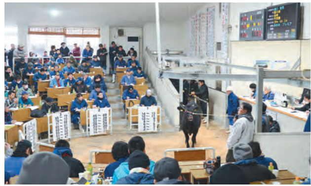
1頭1頭に熱い視線が送られました

1月14日と15日、子牛の初せり市が、船木地区の薩摩中央家畜市場で開催されました。県内外から新たな購買者も訪れ、年初めとしては高値の取引で生産牛農家にとっては嬉しい年明けとなりました。同市場では、昨年1月の子牛平均価格が市場開設以来最高価格(税抜き872千円)を記録。その後は低下傾向でしたが、昨年9月に全国和牛能力共進会で鹿児島県が団体総合成績全国1位に輝いて以来、活発な取引に支えられ子牛価格も高値に転じています。(結果は15ページに記載)