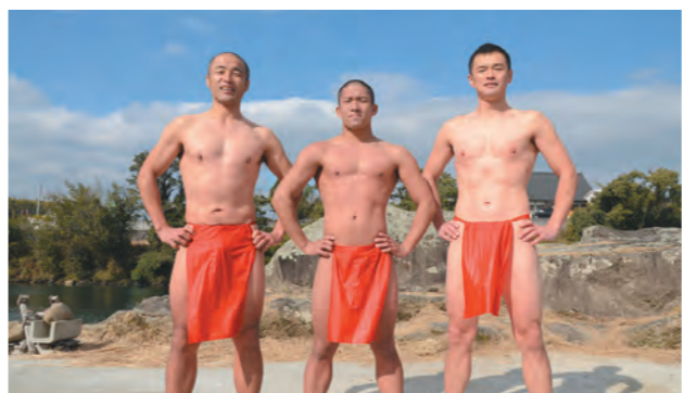
鍛え上げられた身体とふんどし姿に歓声が上がっていました