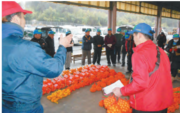
目当ての商品を求める買受人