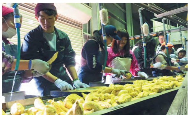
小牧醸造の方に教わりながら芋の洗浄を丁寧に行います

完成した焼酎は、新成人で意見を出し合い「集」と名付けられ、成人式で披露されました。共に学んだ友人たちが集い、祝杯を挙げ思い出話に花を咲かせてほしいという想いが込められています。