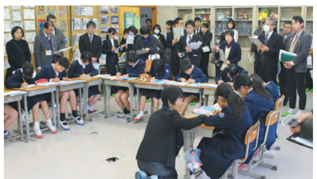
求名小6年生の授業を見学する多くの参加者

公開授業で、求名小は「くもの糸」を題材として、だれでも強い心と弱い心があることを学びました。宮之城中は相手の良いところさがしや、ネットいじめに関することなどをグループごとに話し合う様子を公開。参加者からは「学校だけでなく、地域をあげて人権活動に取り組んでいることが大変参考になった」などの意見がありました。