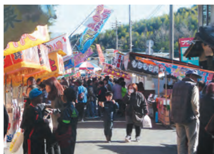
晴天にも恵まれ、多くの人が行き交います

黒木書店の一角ではチャレンジショップが開かれ、これから商工業を始めようとする方々による販売も行われました。