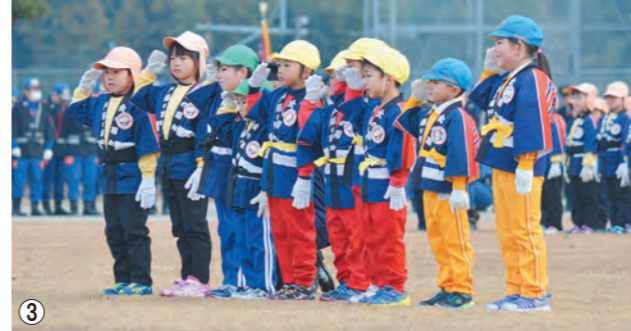
①的に向かって構えるポンプ操法 ②永年の功績を表彰 ③幼年消防クラブの園児たちが、力強く防火を誓いました