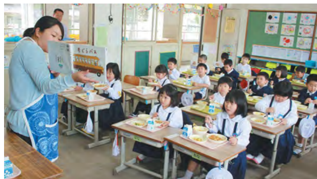
お話を聞きながらだと、もっと美味しいね

盈進小学校1年生の教室では、担任の先生による絵本の読み聞かせが行われ、児童は興味深そうに聞き入りながら、美味しそうにカレーをほおぼっていました。「いつものカレーにはタケノコが入っていないけど、このカレーが一番美味しい」と学校給食を楽しんだ様子でした。