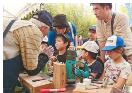
教わりながら竹のおもちゃを作ります

5月5日、宮之城伝統工芸センターまつりが開催されました。竹細工指導員が教える体験コーナーでは、子どもたちが慣れない手つきで竹のおもちゃを製作。作った竹とんぼを飛ばして、かご入れゲームにも挑戦していました。ほかにも、タケノコを的にした輪投げや竹馬、竹ぼっくりなど昔ながらの竹製品遊びも親子で楽しみました。昼食にはタケノコ鍋が振る舞われ、見て食べて、竹の魅力に触れました。