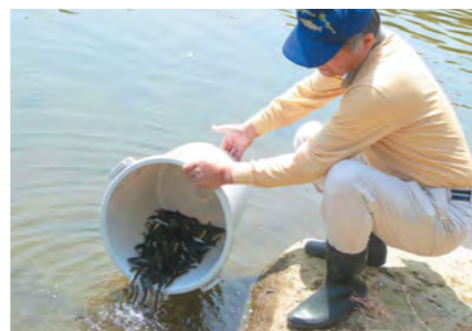
川内川の豊かな水産資源を守ります

4月4日と13日、川内川とその支流で、川内川漁業協同組合によるアユの稚魚放流が行われました。この事業は、安定した水産資源の確保と減少防止のため毎年4月に行われており、今年は体長5cm前後のアユ約170kgを準備。6月1日のアユ釣り解禁に向けて、大きく成長することを願って放流しました。成長すると20cmほどになるアユは、訪れる釣り人を楽しませます。