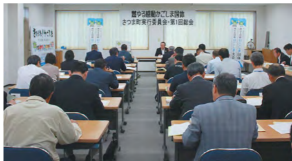
円滑な実施を目指して実行委員会が本格始動しました

5月2日、第75回国体体育大会さつま町準備委員会第3回総会で、燃ゆる感動かごしま国体さつま町実行委員会が設置されました。引き続き行われた実行委員会第1回総会では、役員選任や事業計画などが承認されました。本町では、2020年10月4日から8日まで、15人制のラグビーフットボール競技会（少年男子）が開催されます。