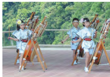
五月晴れの下、様々な芸能が披露されました

5月4日と5日、北薩広域公園春まつりが開催されました。バルーンアートや舞台発表、こどもおもちゃ病院などが日替わりで催され、穏やかな陽気の中、多くの家族連れで会場は大盛況。舞台発表では、吹奏楽や五ツ太鼓、ダンスなど町内外の団体が多数出演し、観客を楽しませました。さつままるちゃんどぐりぶーも登場し、子どもたちは目を輝かせて喜んでいました。