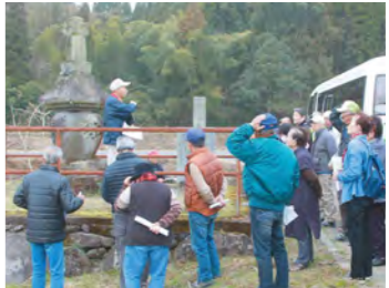
本部主催の史跡巡りの様子

町郷土史研究会の各支部では、新規会員を募集しています。 各支部での活動のほか、5月に本部主催の講演会、2月に史跡巡りまたは研究発表会があります。 興味のある方は、各支部または事務局へお問い合わせください。