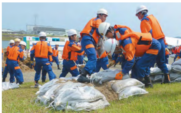
日頃の訓練を活かし、迅速に土のうを積み上げる町消防団員

5月20日、薩摩川内市の開戸橋下流側川内川河川敷で、総合水防演習が開催されました。毎年九州各県を持ち回りで開催され、今年度は川内川流域の市町や消防本部、消防団、警察署、自衛隊、医師会など多くの団体が参加。町からも消防本部水難救助隊員4人、消防団15分団50人が参加し、様々な想定にあわせた水難救助訓練や水防工法作成訓練を実施しました。全国各地で大雨による災害が多発している近年、被害を最小限に止めるための重要な訓練となりました。