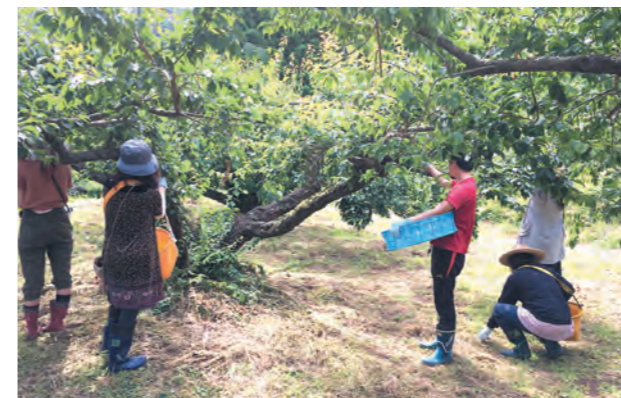
首都圏では味わえない収穫体験を楽しみました

6月2日から2泊3日でさつま暮らし体験ツアーが開催され、首都圏の移住希望者8人が参加しました。参加者は、薩摩切子のカット、梅収穫体験やホテル舟乗船を通して本町の旬を体感。農家民泊や移住体験ハウスに宿泊し、町内の観光資源、空き家などを巡りました。また、地域住民や先輩移住者と意見交換会を行い交流を深め、参加者からは「これから何度かさつま町に来て移住を検討したい」など、移住に向けての様々な意見がありました。