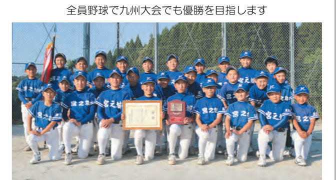
全員野球で九州大会でも優勝を目指します