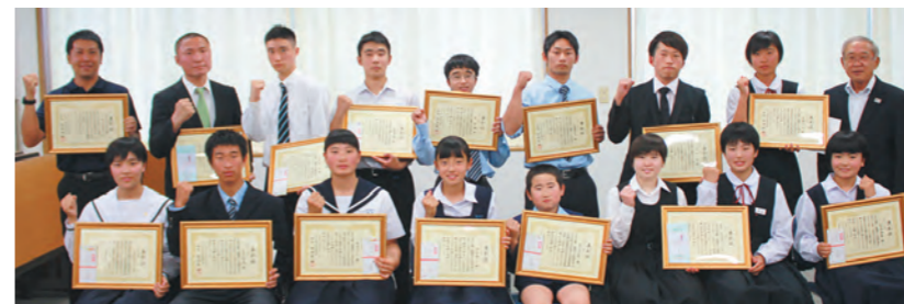
町のスポーツ振興に様々な活動で貢献された皆さん

表彰基準は、県大会で優勝、九州大会または全国大会で入賞、県代表として選抜、体育協会長が特に認めた方、社会体育の振興に貢献し一定の要件を満たす方などです。