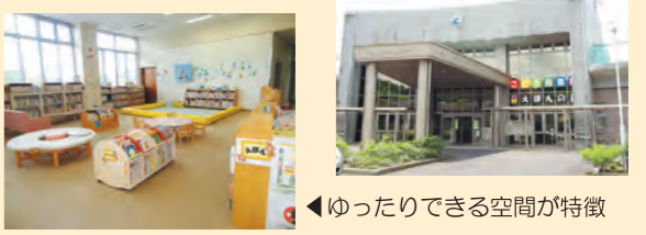
◀ゆったりできる空間が特徴