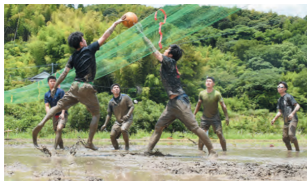
田んぼとは思えない激戦となった決勝戦

た大会はなかなか無いので、来年もぜひ参加して、いい賞品をゲットしたいです」と喜びを語りました。