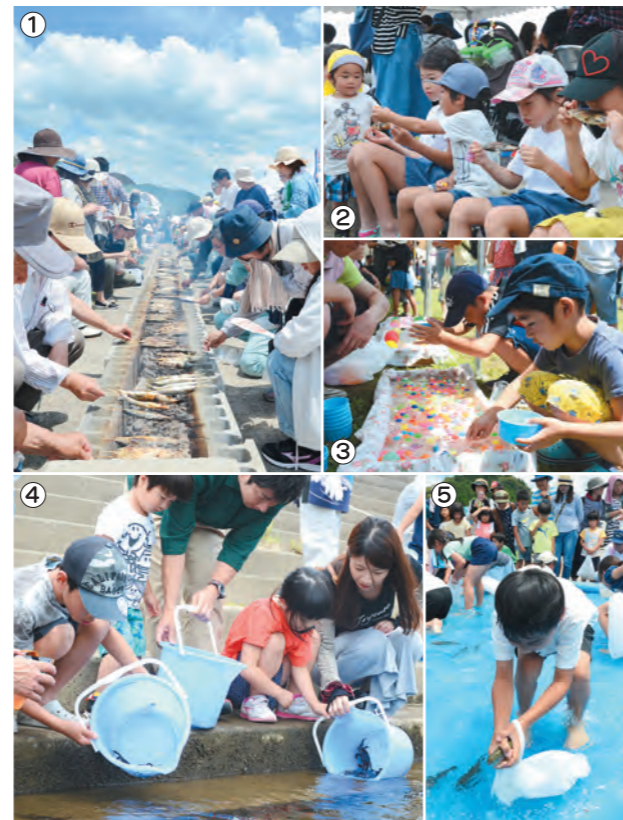
①焼き加減を見極めます②骨まで食べられる鮎は子どもも大好き ③網ですくうのは魚と同じ？④大きく育てと願いを込めて放流 ⑤「逃げないようにしっかりつかんで！」周りの大人も必死です