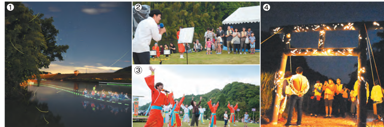
①川岸の木にはたくさんのホタルが。定期的に明滅するホタルのほのかな光が訪れた参加者を優しく包む。（二渡） ②③ホタルを観る夕べでは、川内川に響き渡る歌や観客も一緒になって参加した踊りを川辺で楽しみました。 ④ホタルをモチーフにした大きな灯籠は撮影スポットとしても大人気。これから始まる舟旅への期待が膨らみます。（奥薩摩）