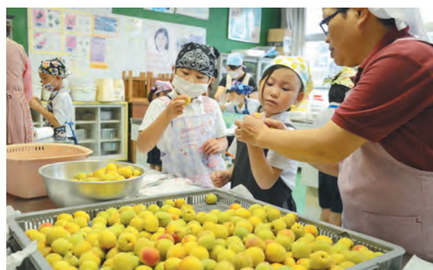
特産の梅について教わりながら丁寧に加工していきます

5月31日、中津川小学校で1・2年生13人が梅の加工を体験しました。特産の梅がどのように加工されるのかを児童に知ってもらうため毎年行われています。児童はグループに分かれて、竹串を使って前日に収穫した実のヘタを取り除きました。梅干し、梅シロップ、カリカリ梅にするため分量を量って瓶詰め。でき上がりを楽しみに待ちます。この日加工した合計22kgの梅は、家庭に持ち帰ったり、運動会の練習後など汗をかいた後の塩分・水分補給に用いられたりします。