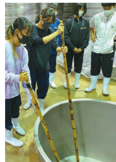
小牧醸造で糺入れに挑戦

19歳の焼酎プロジェクトで、新成人が地元の酒販店や蔵元の協力のもと、オリジナルの芋焼酎を造りました。新成人がサツマイモの苗付けや収穫、焼酎の仕込みなどを行い、祝賀会や同窓会で飲めるようにと企画。焼酎造りに触れて焼酎文化を知り、地元の人と交流してお酒のルールを学びます。焼酎には、