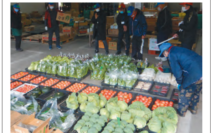
目当ての品を求める買受人