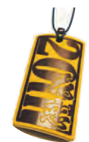
贈られた竹製ストラップ▶

1月4日、佐志地区の農家そばヤマサキとお食事処三四で「新成人のための映える撮影会」が行われました。町内の有志が企画し、約50人の新成人が参加。用意された会場で着飾った姿を撮り合いました。会場では新成人が造った焼酎「我逢人」の振る舞い酒や豚汁なども提供され新成人を祝福。後日、特産の竹を使った名前入りのストラップの記念品が参加者に贈られました。