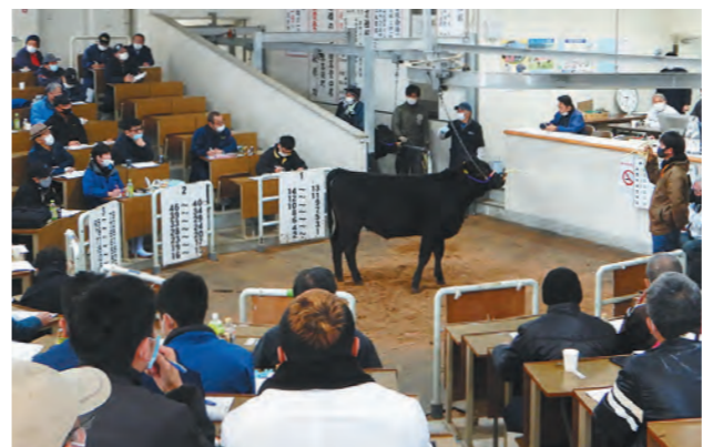
全国トップクラスの高値で取引される薩摩中央家畜市場

1月14日と15日、船木地区の薩摩中央家畜市場で今年初めての子牛のせり市が行われました。生まれて9か月前後の子牛516頭がせりにかけられ、2日間で300人以上の購買者が訪れました。昨年は、新型コロナウイルスの影響で価格が一時期落ち込みましたが、今回は平均価格77万6,795円の高値で取引され、昨年1月と比べて3万309円の高値を記録。生産牛農家にとって喜ばしい年明けとなりました。(20ページに子牛せり市結果を掲載)