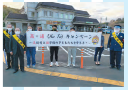
15日 年末特別警戒街頭立哨