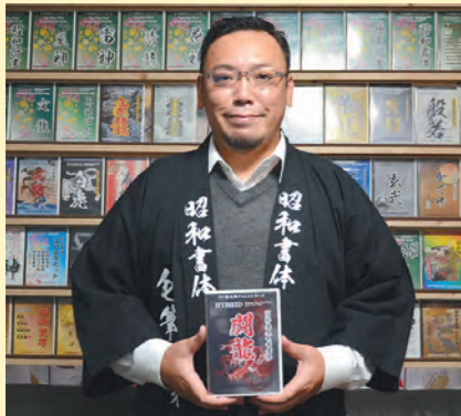
欄昭和書体様から提供いただきました

※個人情報の取扱い…ご記入いただいた個人情報は、お便りのご紹介・賞品発送以外の目的では使用しません。