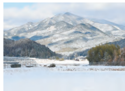
白男川地区から撮影した紫尾山

1月9日と10日、本町に10センチほどの雪が積もりました。一面真っ白な世界が広がり、子どもたちが頬を真っ赤にしながらかぶる雪だるまを作ったり、雪玉を投げ合ったりして遊んでいる姿が見られました。風で木々が揺れ、太陽の光で雪がキラキラと輝きながら舞い散る様子は、ため息が出るほど美しい光景でした。