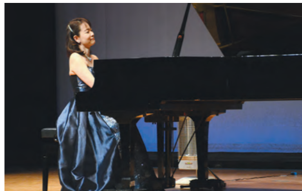
自身が作曲した映画音楽やリクエスト曲を披露