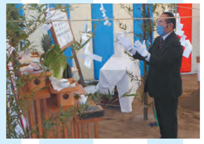
17日 新鶴田小学校安全祈願祭