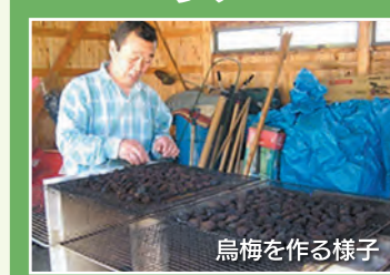
烏梅を作る様子 【出典】村上光太郎著「食べる薬草事典」「薬草を食べる」

ウメは、病原菌の殺菌作用をはじめ、各種鎮痛作用、代謝異常を治すなど広い効果が、食べ物、血液、血液以外の体液に関わる毒を断つとされてきました。食べ物に付着する毒は、ウメのもつ強い抗菌作用、整腸作用、解毒作用で解消。血液の代謝は、クエン酸による代謝促進やピクリン酸による肝機能活性化により解消します。また、カリウムやカリウムなどの豊富なミネラルが、不要な水分の除去に作用します。ウメには痛みを抑える作用があり、特に烏梅の鎮痛作用は強力です。烏梅は青ウメを広葉樹などでくん製にしたもので、煙に含まれるカルシウム、カリウム、マグネシウムなどが取り込