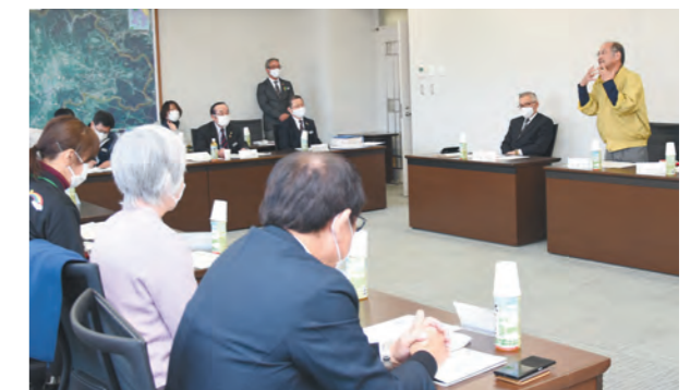
多文化共生に向けて活発な話し合いが行われました

今回は、鹿児島大学、県国際交流協会、外国人の受入関係企業、地域や各種団体の代表、一般公募した町民の10人が参加。現状報告や地域での交流イベントの紹介、コミュニケーションに有効な「やさしいにほんご」の説明などがありました。今後、外国人に対する災害支援体制の整備や行政情報の効果的な発信、外国人と連携した地域づくりなどについて協議を重ね推進していきます。