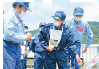
28日 国土交通大臣災害視察対応