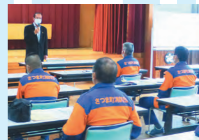
2日 消防団幹部会議