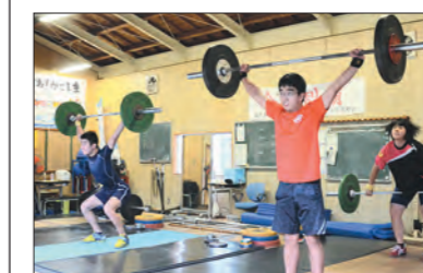
ウエイトリフティング部