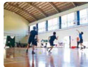
スポーツ・文化活動

食べる カフェスペース「でんでんカフェ」では、「笑顔で楽しく村おこし」を合言葉に、地元の新鮮な食材を使った懐かしい味わいの里山ごはんを提供しています。