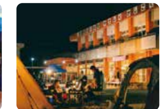
夜キャンハロウィン